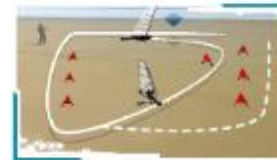
Char à voile à speed sail