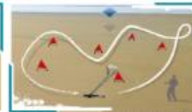
Char à catamaran